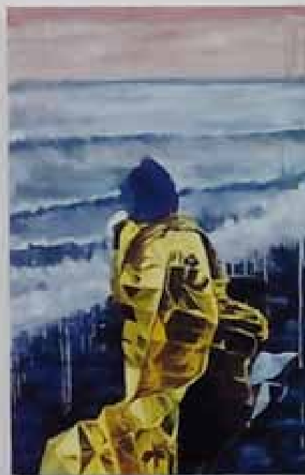
Ensemble «les Couvertures de survie» exposées à la Maison des Metalos en 2016