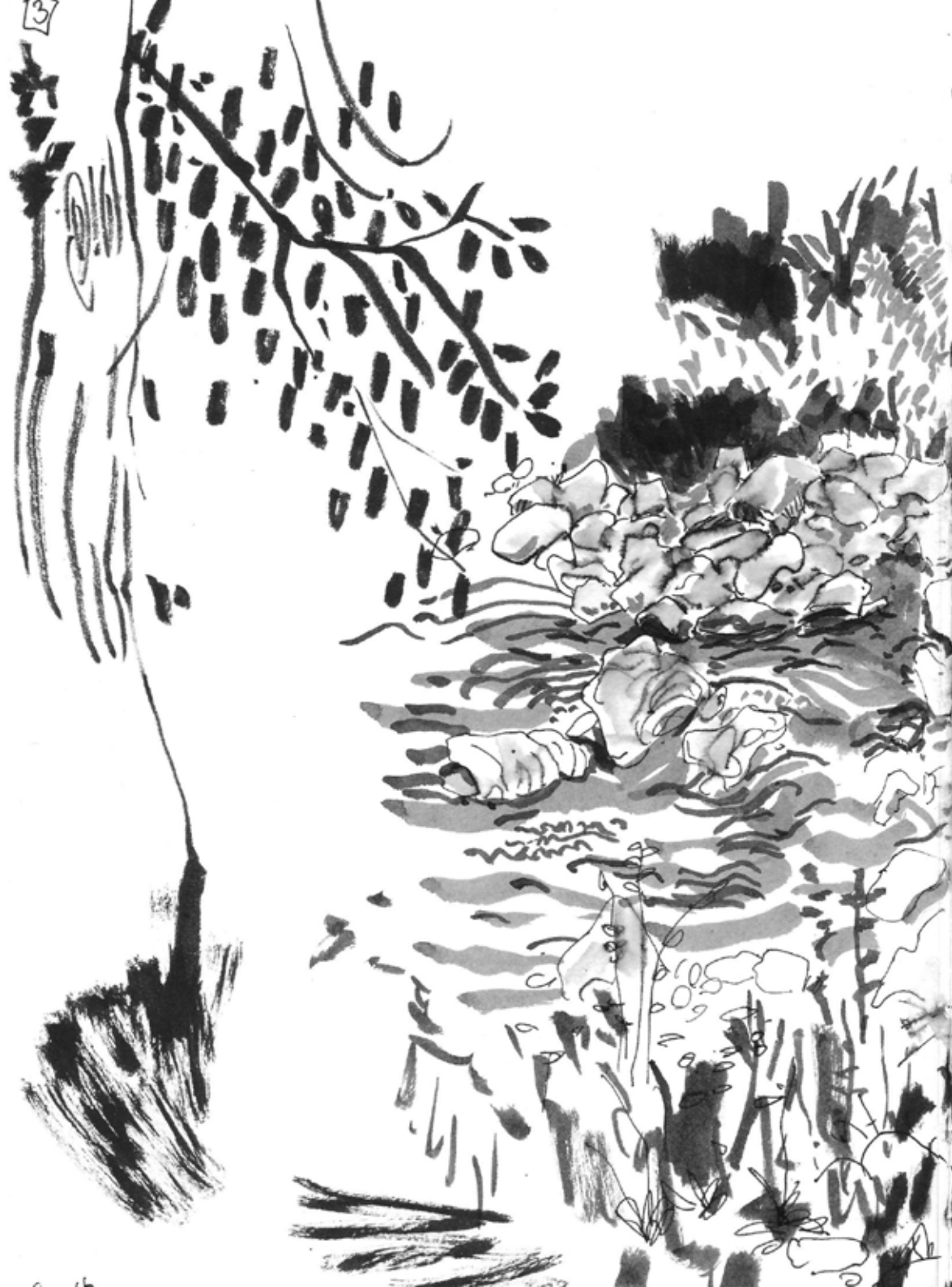
La rivière 1 Encre sur papier 2017 42 x 29,7 cm